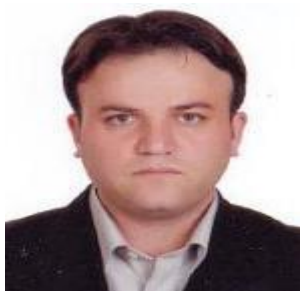
دکتر محسن شهلائی